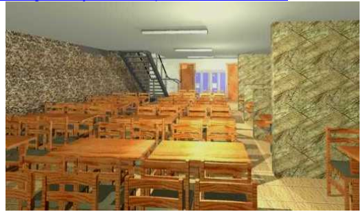
Vista en 3D de la planta baja del proyecto de cantina.

localización de la misma no es la adecuada para un local donde se elaboran comidas. Si querés conocer más el proyecto, ingresá al sitio http://www.fing.edu.uy/servadm/plandeobras/52.html