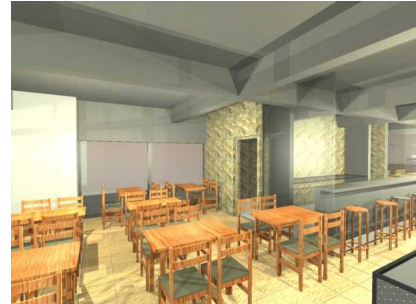
Vista en 3D de la planta alta del proyecto de cantina.

También se considera necesario realizar una importante inversión en temas relativos a la seguridad y a las condiciones físicas de trabajo.