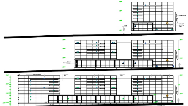
Corte de las fachadas de los 3 edificios que componen el Aulario FARO y las consiguientes etapas de construcción.

Las obras comenzarán durante el presente mes de mayo. Si querés acceder a mayor información sobre el proyecto entrá en: http://www.fing.edu.uy/servadm/plandeobras/faro.html