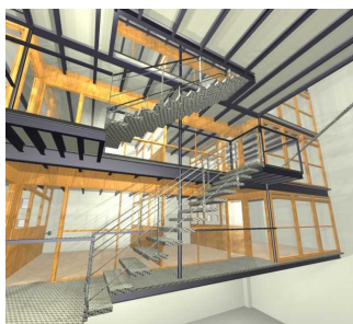
Vista 3D del proyecto de entresijos en el Cuerpo Sur

También se entiende que se precisa más áreas de laboratorios. Carreras como las que se dictan en Ingeniería requieren de laboratorios (incluidos bajo este nombre las salas de computadoras) donde los estudiantes adquieran conocimientos y experimenten. Esto, junto con la racionalización del uso del espacio y la creación de entresijos es otra de las prioridades. http://www.fing.edu.uy/servadm/plandeobras/50.html