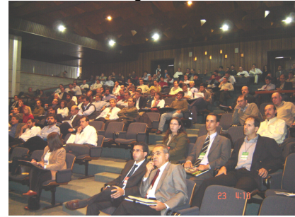
Fotografía de la concurrencia al URUMAN 2005

profesionales del ramo de la gestión desarrollada en la Facultad de Ingeniería posiciona muy bien a nuestra institución. La convocatoria al 2do. Congreso Uruguayo de Mantenimiento, Gestión de Activos y Confiabilidad es en agosto del 2006.