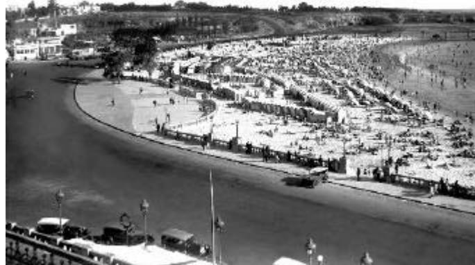
¿y la Facultad???? (La Playa Ramírez en 1935,)