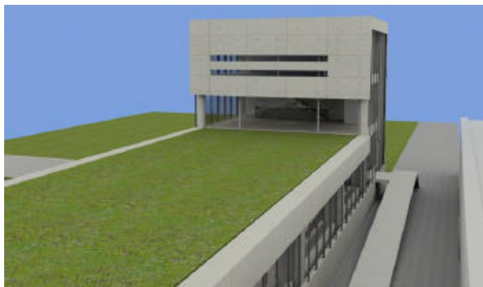
Y ahora, un poco de futurismo con el Edificio Polifuncional Faro.