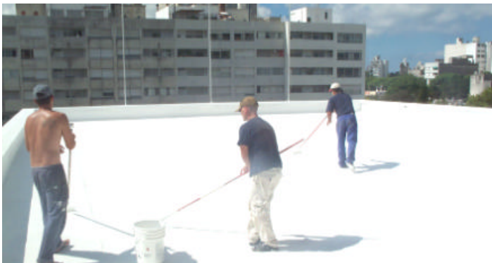
Antes, durante y después de la azotea del Salón de Actos.