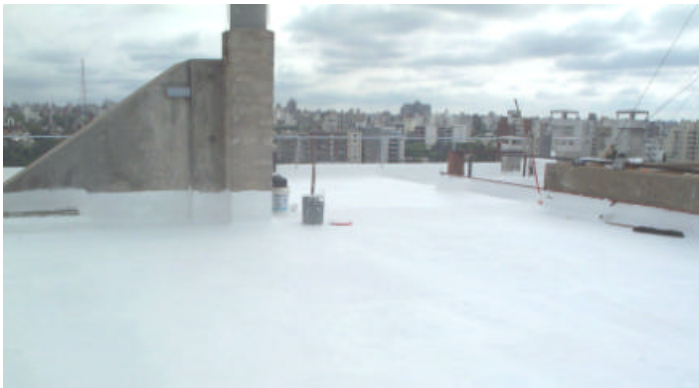
Antes y después de la azotea del 5to. piso.